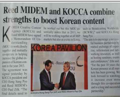
MIP News MOU기사(리드미렘)