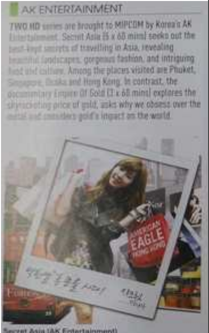
Secret Asia(AK Entertainment)

KOREA's Studio Gale brings Circus Show to MIPCOM. A little lion called Grami dreams of being a circus star. He eagerly performs his best routines with team members Nemo and Sam, hoping to impress the audience. But he has a lot of work to do before he can be as good as the best circus performers.