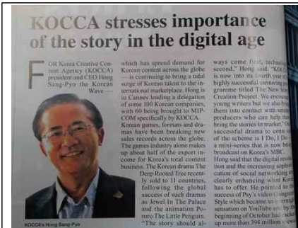
MIP News 원장님인터뷰