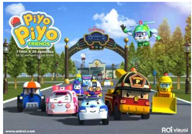
로이비주얼 <로보카 폴리>