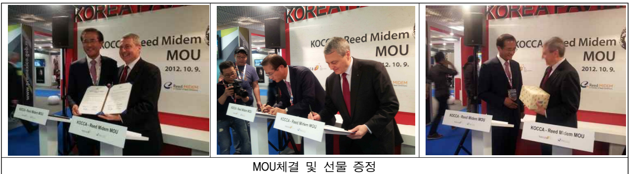
MOU체결 및 선물 증정