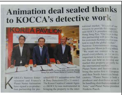
MIP News 업무지원 협정(선우)