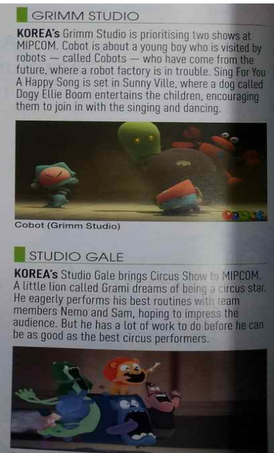
Cobot (Grimm Studio)