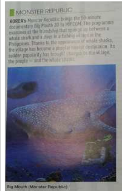
Big Mouth (Monster Republic)