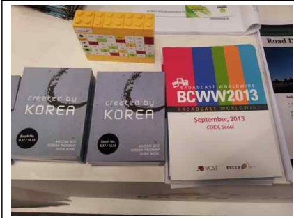
가이드북 및 BCWW홍보물