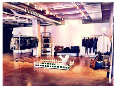
[Idiel Showroom 전경]