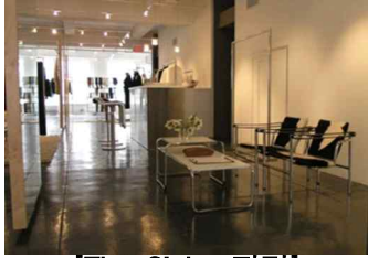
[The Globe 전경]