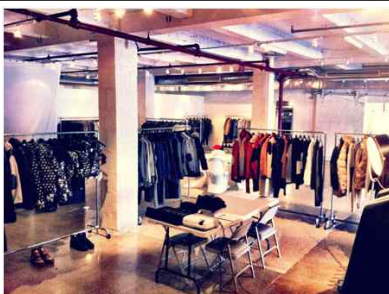
[Idiel Showroom 전경]