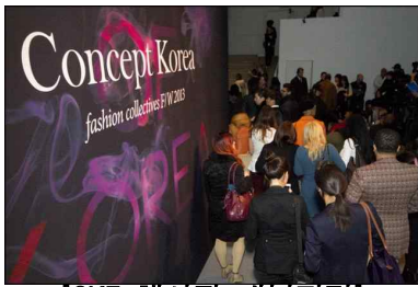
[CK7 행사장 내부전경]