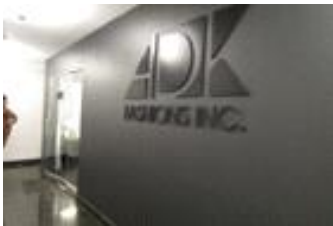
[ADK Showroom 전경]