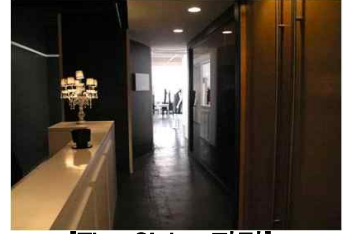
[The Globe 전경]