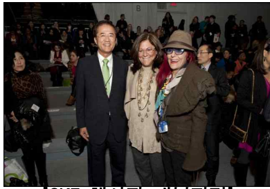
[CK7 행사장 내부전경]