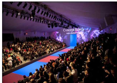
[CK7 행사장 내부전경]