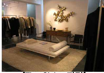
[The Globe 전경]