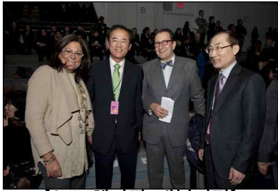
[CK7 행사장 내부전경]