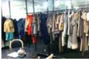
[The Globe 전경]