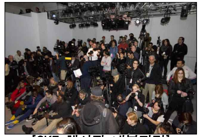
[CK7 행사장 내부전경]