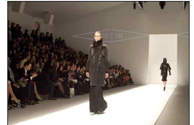
[CRES. E DIM.]