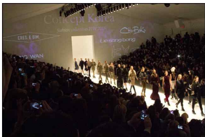
[모델 전체 컷워크]