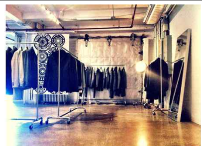
[Idiel Showroom 전경]