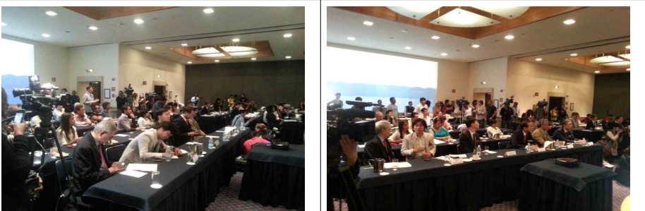
행사장 전경 1