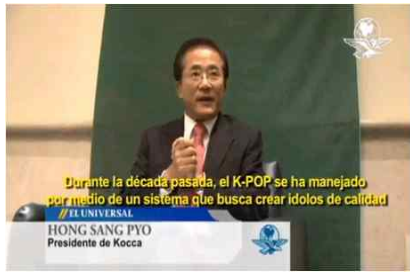
El Universal TV 인터뷰 방영