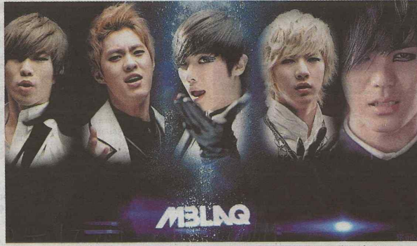
Televisa va a mandar a Reik a Corea y los coreanos nos van a mandar al grupazo pop llamado MBLAQ.

Ahí se lo dejo de tarea, porque suena polémico, como el principio del fin. ¿A poco no?