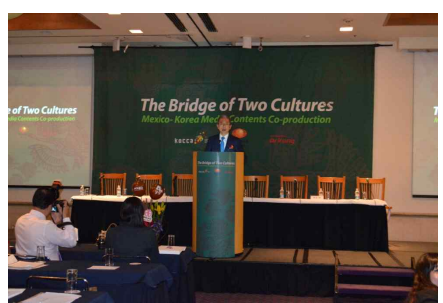
주멕시코 흥성화 대사 축사