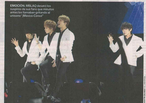
EMOCIÓN. MBLAQ desató los suspiros de sus fans que minutos antes los llamaban gritando al unísono “¡México-Corea!”

Los artistas se encuentran desarrollando un reality junto a Reik, banda que visitará Corea en octubre