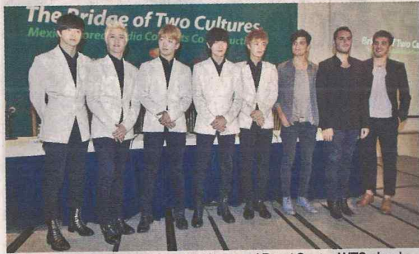
La banda de k-pop se presentará hoy en el Pepsi Center WTC, donde tendrá a los chicos de Reik como invitados.