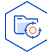
개인정보의 처리 목적