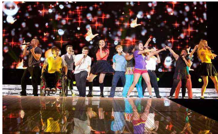
출처: Glee The 3D Concert Movie