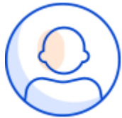
일반 개인정보 수집