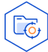
개인정보의 처리 목적