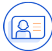
고유 식별정보 수집