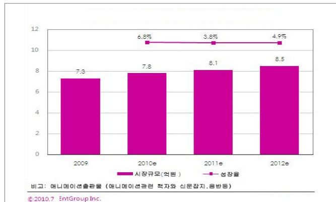
Ⅱ 도표 3 Ⅱ 2009~2012 애니메이션관련 출판물시장 성장률