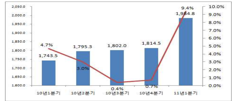
<표 4> '10년 1분기~'11년 1분기 지식정보산업(상장사별) 영업이익액 변동