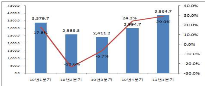
<표 4> '10년 1분기~'11년 1분기 광고산업(상장사별) 영업이익액 변동