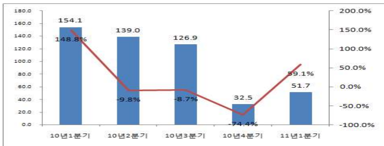
<표 4> '10년 1분기~'11년 1분기 음악산업(상장사별) 영업이익액 변동