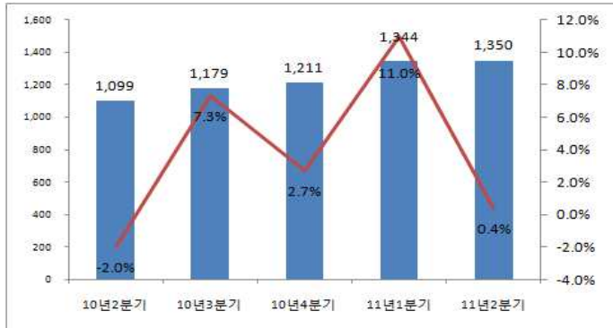
<그림 4> '10년 2분기~'11년 2분기 영화(상장사) 종사자 수 변동 (단위: 명, %)