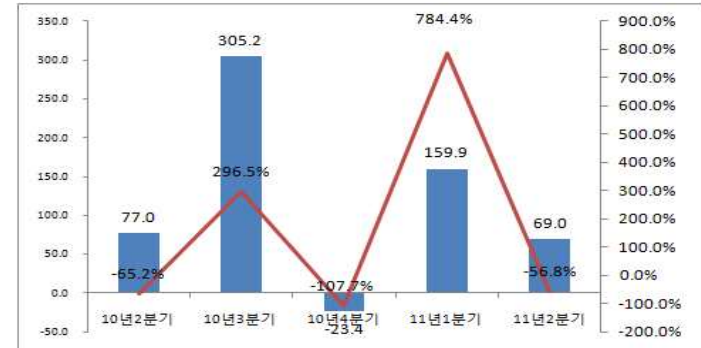
<표 6> '10년 2분기~'11년 2분기 영화산업(상장사별) 종사자수 변동