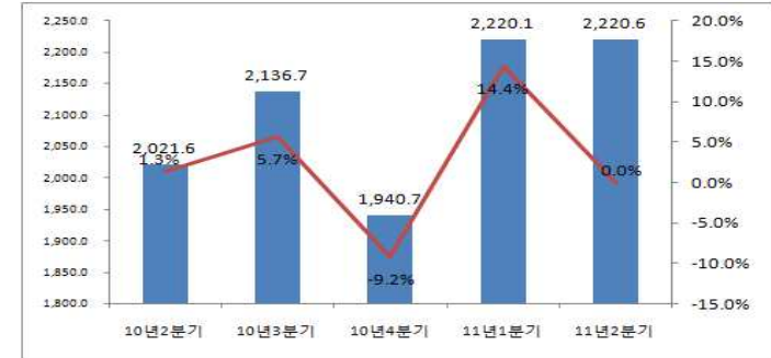
<표 5> '10년 2분기~'11년 2분기 지식정보산업(상장사별) 종사자수 변동