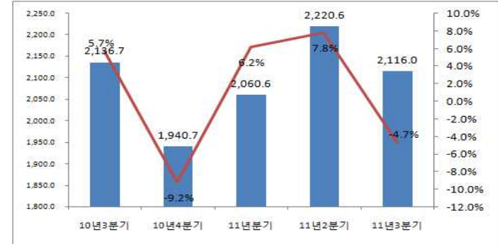
<표 5> '10년 3분기~'11년 3분기 지식정보산업(상장사별) 종사자수 변동