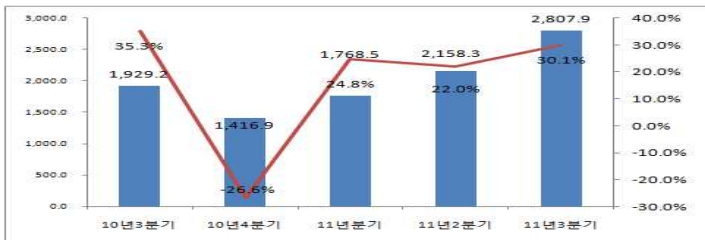
<표 4> '10년 3분기~'11년 3분기 영화산업(상장사별) 수출액 변동