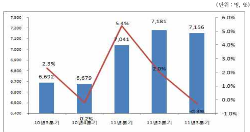
<그림 4> '10년 3분기~'11년 3분기 출판(상장사) 종사자 수 변동