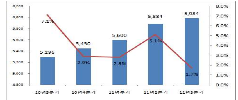
<그림 4> '10년 3분기~'11년 3분기 방송산업(방송영상물독립제작사 포함)(상장사) 종사자 수 변동 (단위: 명, %)