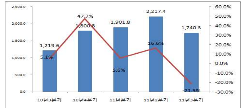
<표 6> '10년 3분기~'11년 3분기 방송산업(방송영상물독립제작사 포함)(상장사별) 종사자수 변동 (단위: 명, %)