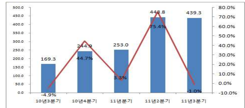
<표 5> '10년 3분기~'11년 3분기 방송산업(방송영상독립제작사 포함)(상장사별) 영업이익 변동 (단위: 억원, %)