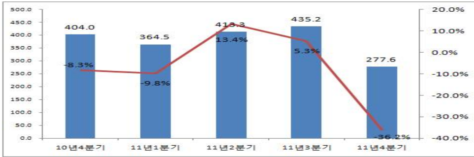
<표 7> '10년 4분기~'11년 4분기 출판/만화산업(상장사별) 종사자수 변동