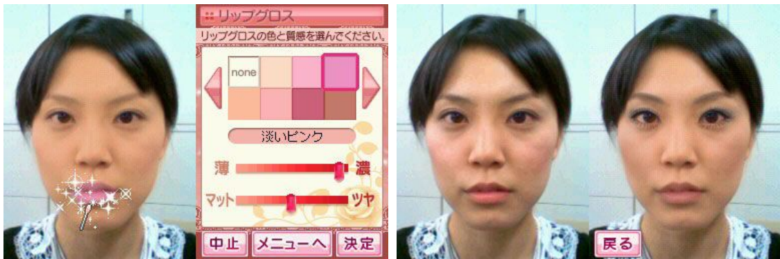
Figure Project Beauty 게임 화면