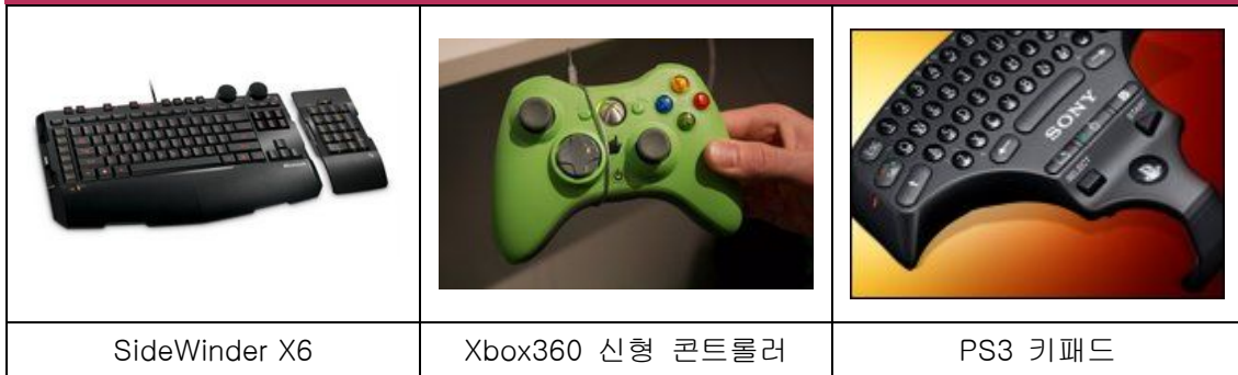
Figure 신형 콘트롤러